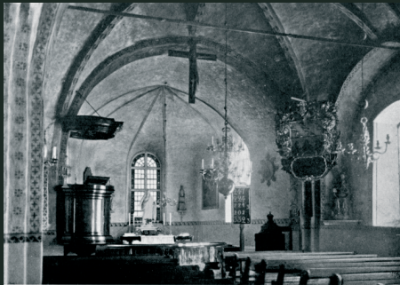
Kyrkans interiör före 1950 års renovering. Notera t ex korfönstret, som murades igen då Kristusfiguren som byttes ut mot det stora krucifixet, Madonnan och S:t Olof har kommit ned från vinden. Det Sölverbergska begravningsvapnet sitter här på sin ursprungliga plats. Bilden är tagen 1936.