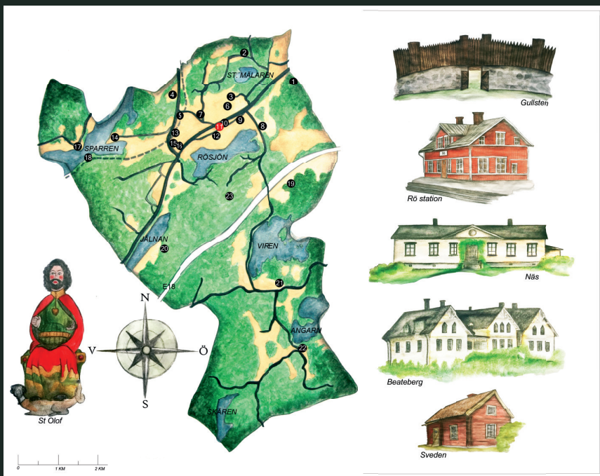
Illustrationer Caroline R Daag